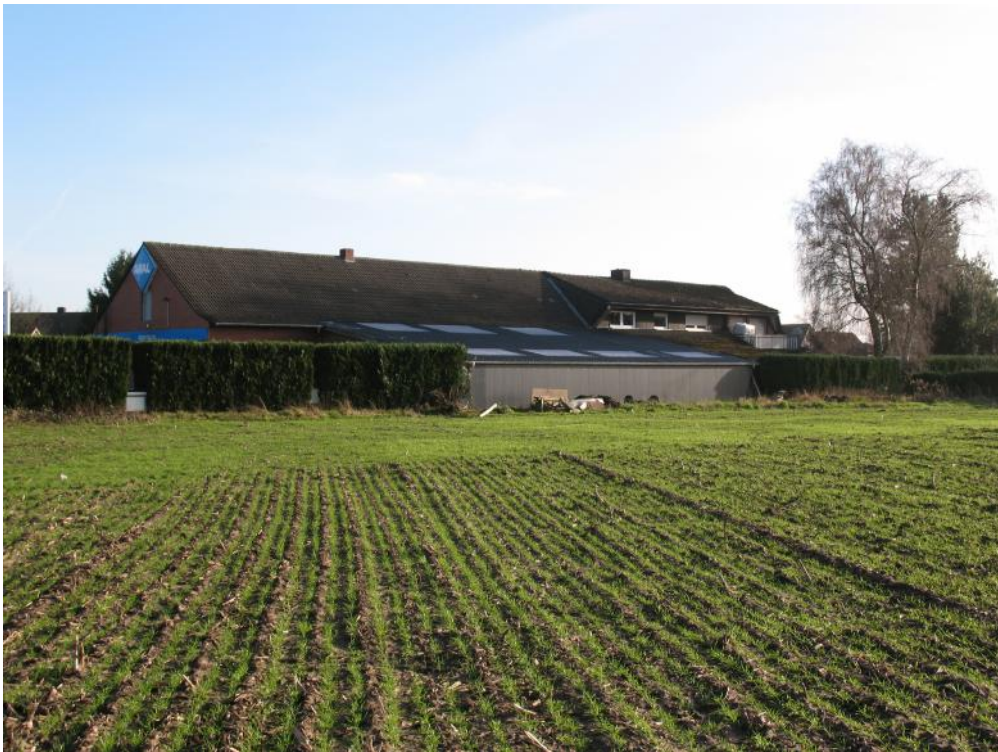
Die Tankstelle am nördlichen Ortseingang soll auf der rückwärtig gelegenen Ackerfläche erweitert werden. (Fotos 28.12.2015)